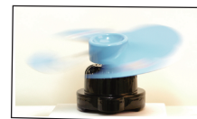
羽根の軸が上下左右 28° 回転します