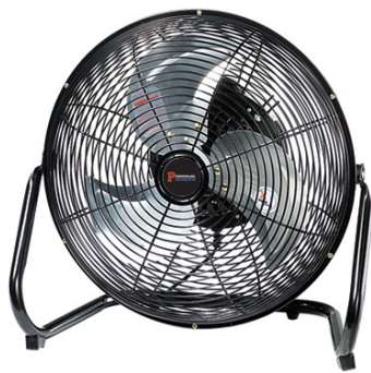
PM-350JS 35cm 羽根回転式循環扇