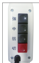
スイッチ部 3段階押しボタン式