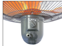
スイッチ部ダイヤル式