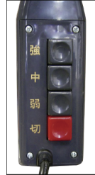
スイッチ部 3段階押しボタン式